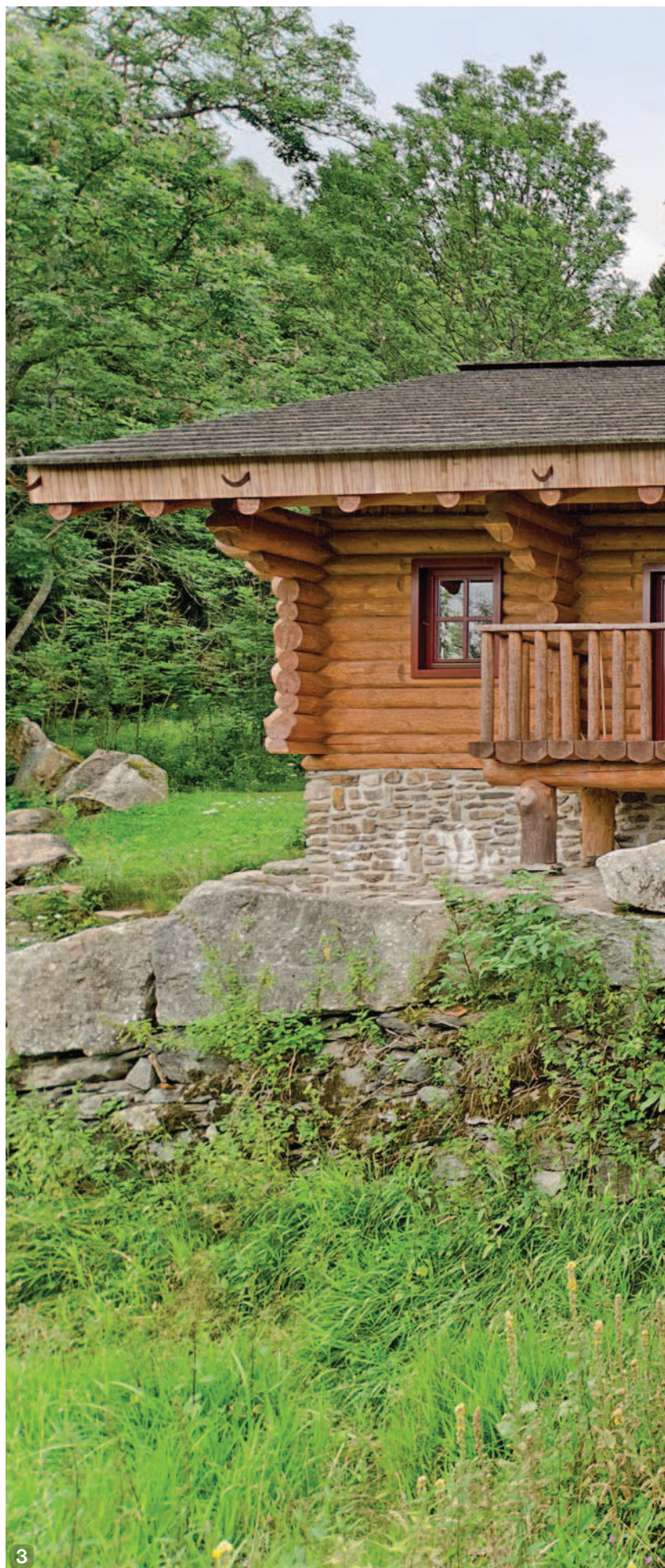
2, 3 ROZVALINY BÝVALÉHO STAVĚNÍ POSLUŽILY PRO ÚPRAVU TERÉNU V OKOLÍ SRUBU. VĚTŠÍ PŘESAŘ STŘECHY SI MAJITEL NEMŮŽE VYNACHVÁLIT, DOBRĚ SE POD NÍM SEDÍ V LÉTĚ I ZA NEPŘÍZNIVÉHO POČASÍ