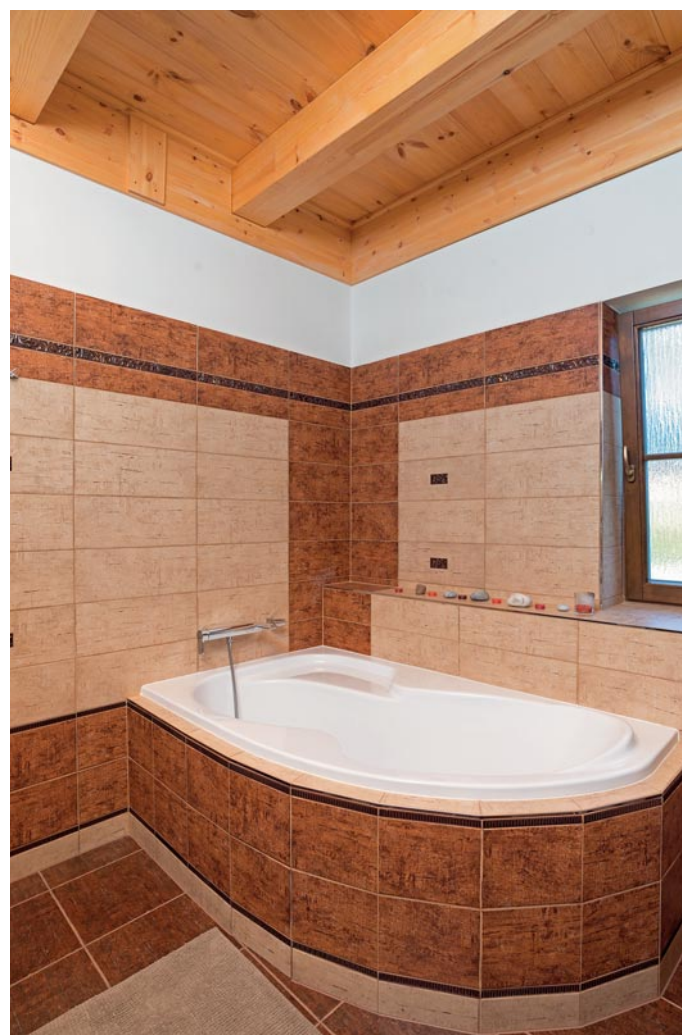
NA HNĚDÉ KOUPELNĚ SE MAJITELÉ SHODLI NA PRVNÍ POHLED

Připravila Helena Petáková